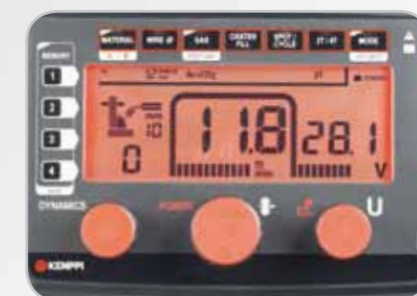
Панель управления Kemract A