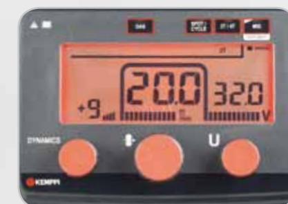
Панель управления Kemract R

Модели Adaptive (A) имеют все стандартные функции, а также каналы памяти и режим адаптивной настройки, в котором мощность сварки устанавливается автоматически в соответствии с выбранной толщиной листа.